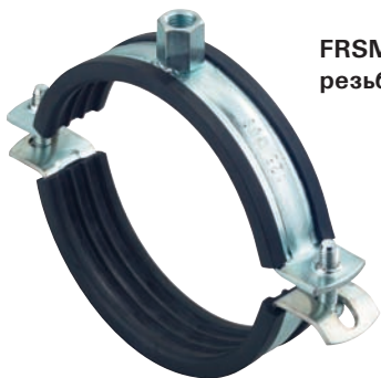
FRSM с метрической резьбой M10/M12/M16