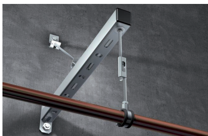
Крепление к консоли