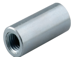
Переходная муфта RDM