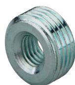
Переходная муфта GRD