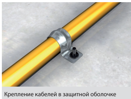
Крепление кабелей в защитной оболочке