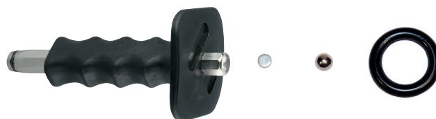
Установочный инструмент для забивания гвоздей по бетону SZE