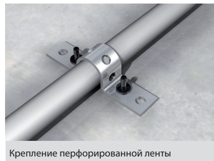
Крепление перфорированной ленты