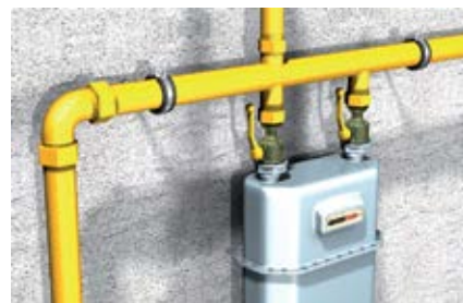
Крепление газовых расходомеров