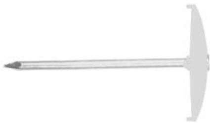
Гвоздь с шайбой NSB