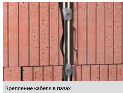
Крепление кабеля в пазах