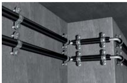
Крепление стальных трубопроводов в защитной оболочке