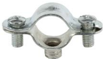
Металлический двухсторонний зажим для труб AM