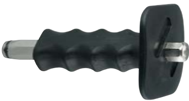
Установочный инструмент для забивания гвоздей по бетону SZE