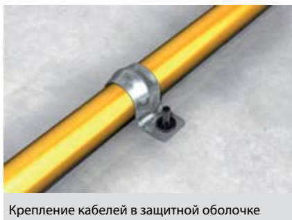
Крепление кабелей в защитной оболочке