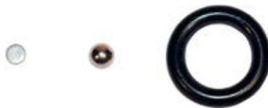
Комплект принадлежностей для SZE