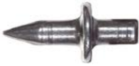
Гвоздь для крепления прижимов ED