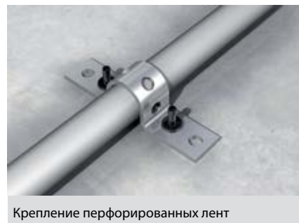
Крепление перфорированных лент