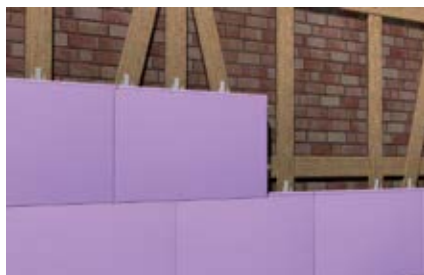
Прочные на сжатие термоизоляционные панели в деревянных подконструкциях