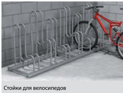
Стойки для велосипедов