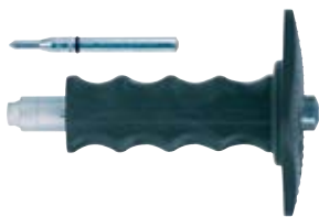
Установочный инструмент FZE plus