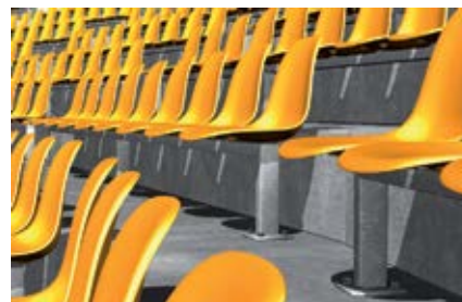
Сиденья на стадионах