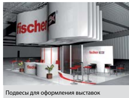
Подвесы для оформления выставок